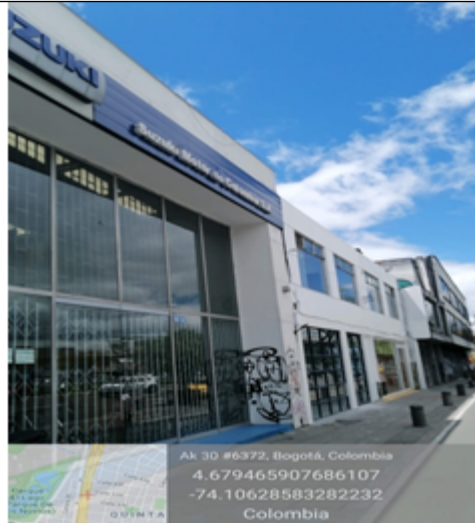
Foto 2. Vista del predio en donde estaba ubicada la valla en la Av. Carrera 30 No. 63C-46, orientación Sur-Norte.