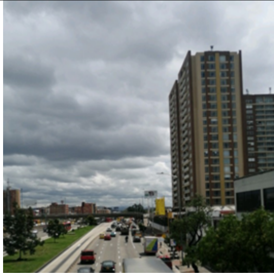
Foto 1. Vista panorámica del predio en donde estaba ubicada la valla en la Av. Carrera 30 No. 63C-46, orientación Sur-Norte.